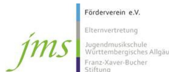
Förderverein der JMS e.V. Wangen im Allgäu